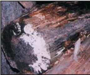
Moho creciendo sobre leña al exterior. Los mohos tienen varios colores, esta foto enseña ambos mohos blanco y negro.

¿Por qué crece el moho en mi hogar? Los mohos forman parte del medio ambiente natural. Al exterior, los mohos juegan un papel en la naturaleza al desintegrar materias orgánicas tales como las hojas que se han caído o los árboles muertos. No obstante, al interior, es necesario evitar el moho. Los mohos se reproducen mediante esporas; las esporas son invisibles a simple vista y flotan en el aire exterior e interior. Las esporas de mohos se hallan normalmente presentes en el aire exterior e interior. El moho puede crecer al interior cuando las esporas caen sobre