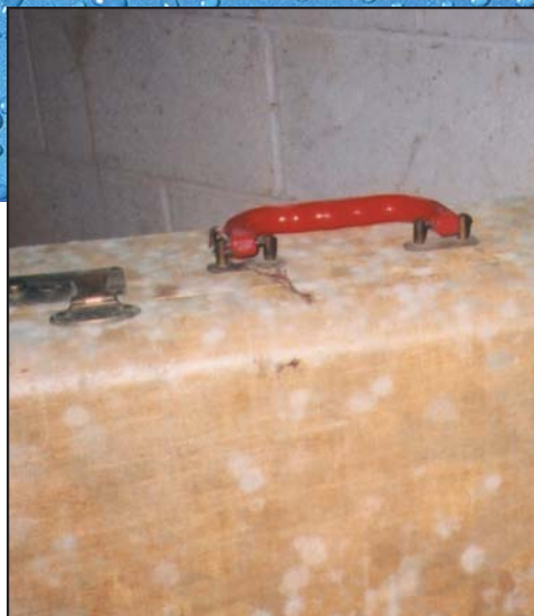
Moho creciendo en una maleta guardada en un sótano húmedo.

Es importante tomar precauciones que limiten su exposición al moho y a las esporas de moho.