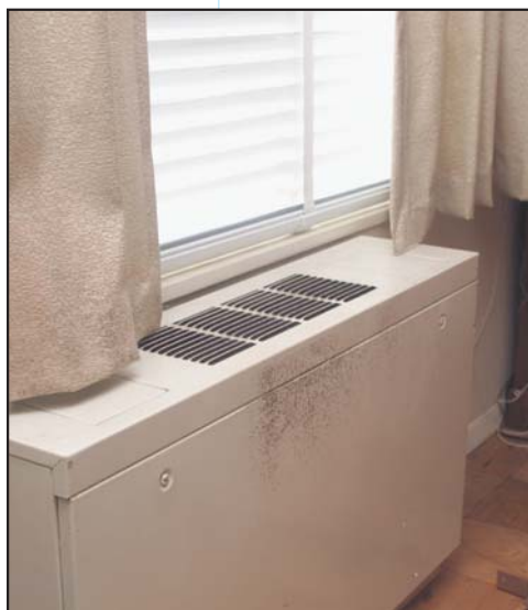
Moho creciendo sobre la superficie de un ventilador.