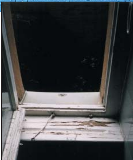
Ventana con fugas - el moho está empezando a crecer en el marco de madera y en el apoyo de la ventana.

Si ya tiene un problema con el moho — ACTÚE RÁPIDAMENTE.