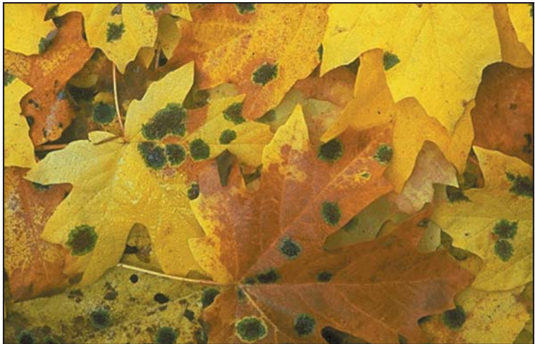
Moho creciendo en hojas caídas.

Se puede obtener este documento del sitio Web de la División para Medio Ambientes Interiores, EPA en www.epa.gov/iaq/molds/moldguide.html