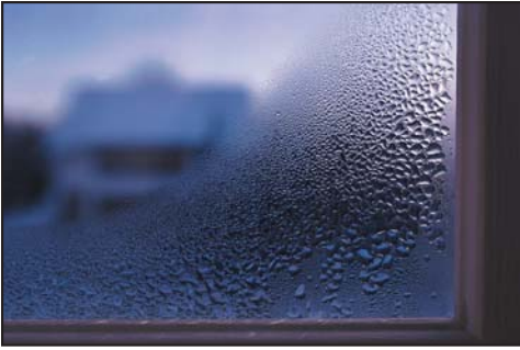
Condensación en el interior del vidrio de la ventana.