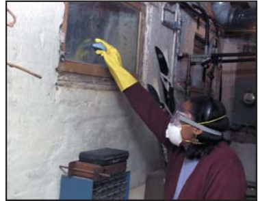
Persona limpiando con respirador N-95, guantes y gafas de protección.